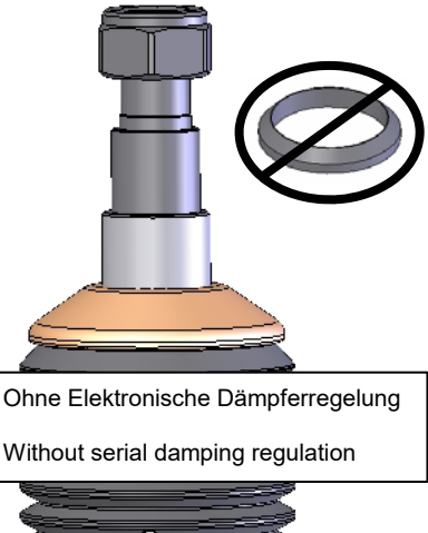
Ohne Elektronische Dämpferregelung Without serial damping regulation

Original Stützlager ohne den serienmäßigen Faltenbalg (Staubschutz) aufstecken und mit der mitgelieferten Stopfmutter verschrauben. Das Anzugsdrehmoment der Kolbenstangenbefestigung beträgt 50 Nm. Die Montagehinweise zum Einbau des Federbeines in das Fahrzeug, sowie die Anzugsdrehmomente der Federbeinbefestigung, entnehmen Sie bitte den Unterlagen des Fahrzeugherstellers.