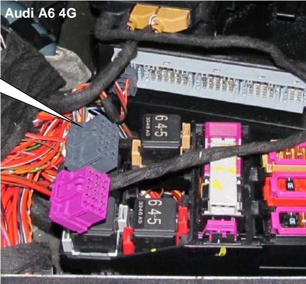
Audi A6 4G

Diese Stecker werden nicht mehr benötigt These connector are no longer needed.