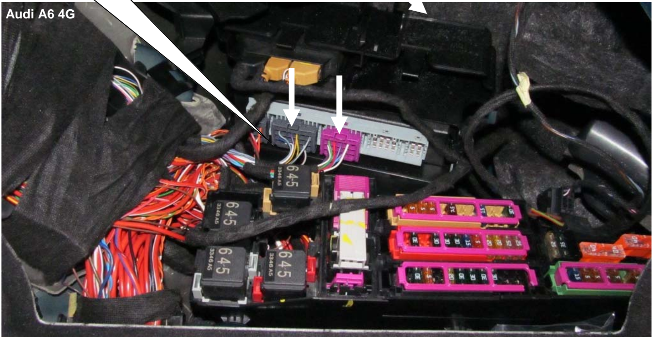
Audi A6 4G

Markierte Stecker ausstecken. Unplug the market connector.