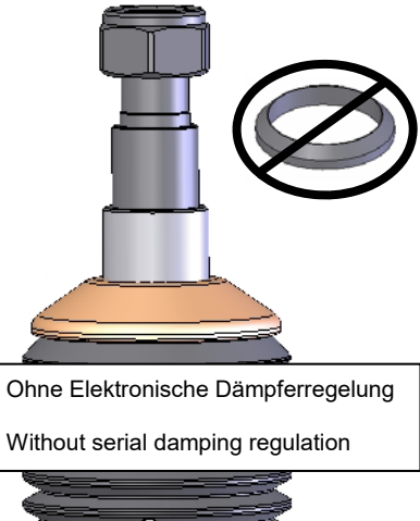
Ohne Elektronische Dämpferregelung Without serial damping regulation

Original Stützlager ohne den serienmäßigen Faltenbalg (Staubschutz) aufstecken und mit der mitgelieferten Stopfmutter verschrauben. Das Anzugsdrehmoment der Kolbenstangenbefestigung beträgt 50 Nm. Die Montagehinweise zum Einbau des Federbeines in das Fahrzeug, sowie die Anzugsdrehmomente der Federbeinbefestigung, entnehmen Sie bitte den Unterlagen des Fahrzeugherstellers.