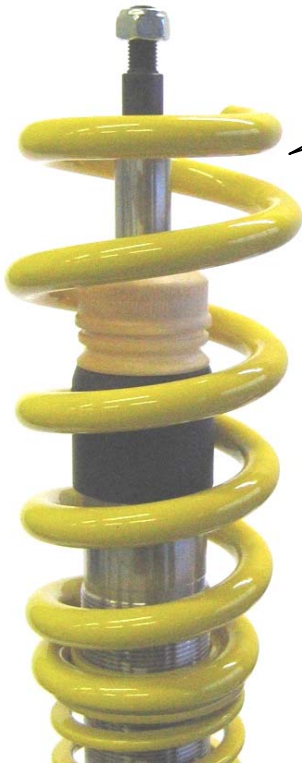
Angeliefertes Federbein. Supplied coilover strut

Das Original Domlager aufsetzen und mit der im Lieferumfang enthaltenen Mutter festschrauben. Das Anzugsdrehmoment der Kolbenstangenbefestigung beträgt 40 Nm. Die Montagehinweise zum Einbau des Federbeines in das Fahrzeug, sowie die Anzugsdrehmomente der Federbeinbefestigung, entnehmen Sie bitte den Unterlagen des Fahrzeugherstellers.