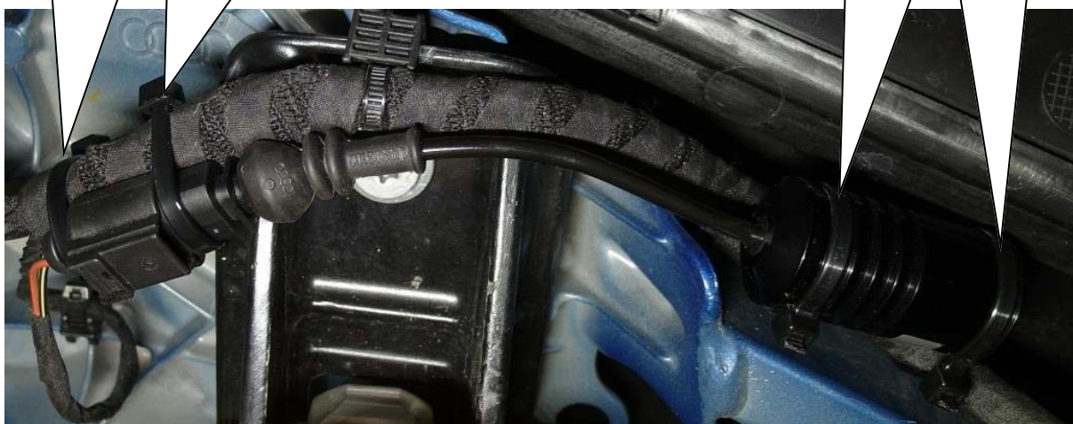
Kabelbinder / Cable ties