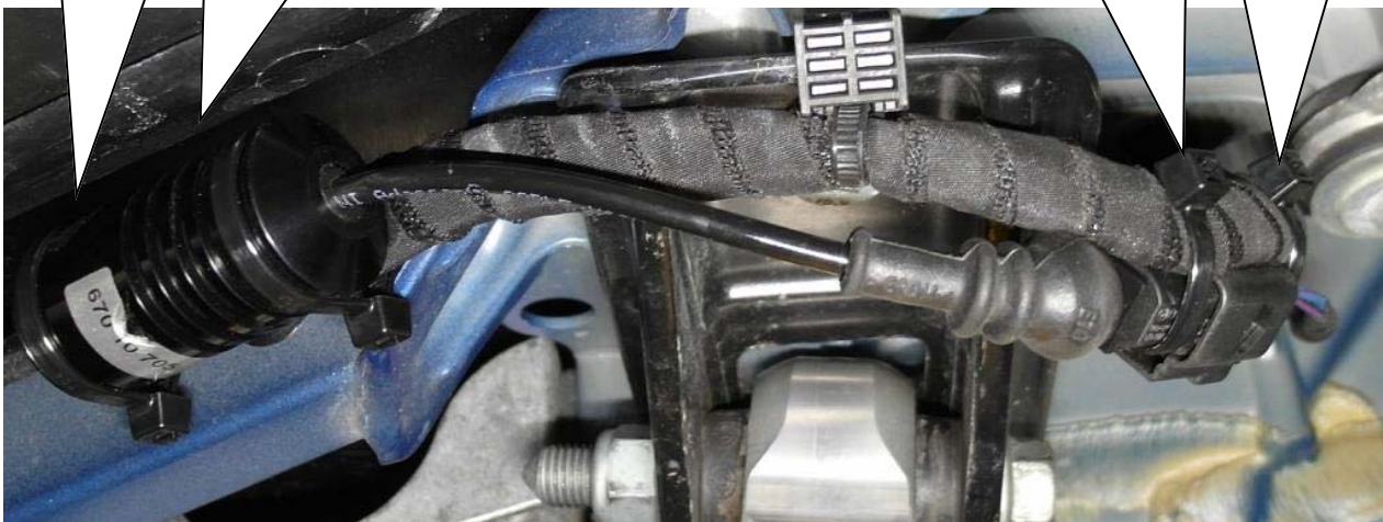
Kabelbinder / Cable ties