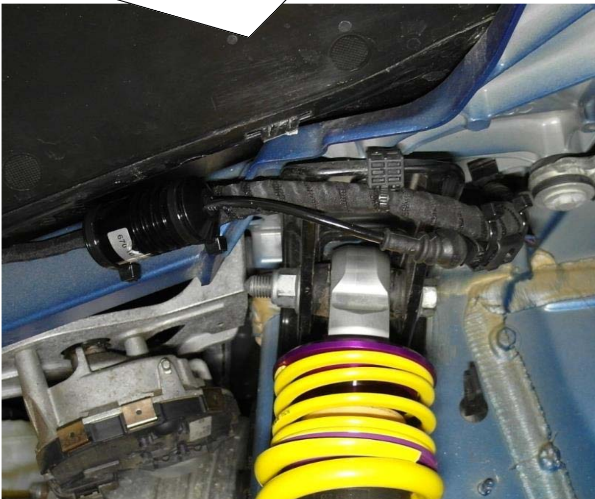
Kabelbinder / Cable ties

Dämpfersteuerungsleitung in die Stilllegung einstecken. Auf die korrekte Verriegelung des Steckers achten! Stilllegung mit den mitgelieferten Kabelbindern am Kabelbaum befestigen. Run the standard damper control wire to the canceller connector. Insert the connector into the canceller connector until it locks. Fix the canceller with supplied cable ties on the vehicle chassis.