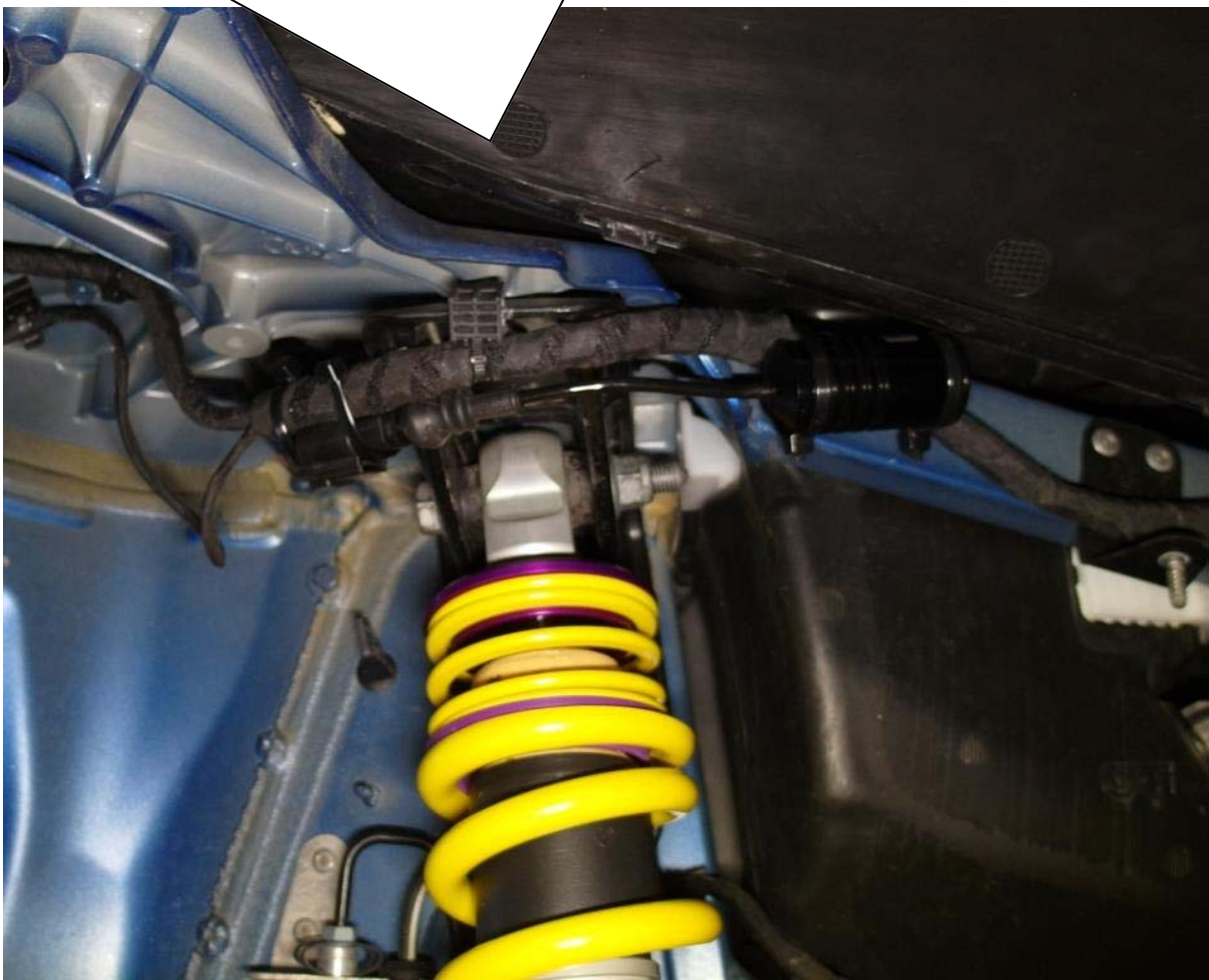
Kabelbinder / Cable ties

Dämpfersteuerungsleitung in die Stilllegung einstecken. Auf die korrekte Verriegelung des Steckers achten! Stilllegung mit den mitgelieferten Kabelbindern am Kabelbaum befestigen. Run the standard damper control wire to the canceller connector. Insert the connector into the canceller connector until it locks. Fix the canceller with supplied cable ties on the vehicle chassis.