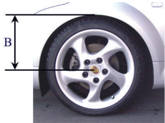
Abstandsmaß B - Radmitte - Kotflügelunterkante

In dieser Tabelle ist die eingestellte Höhe des umgerüsteten Fahrzeugs einzutragen: