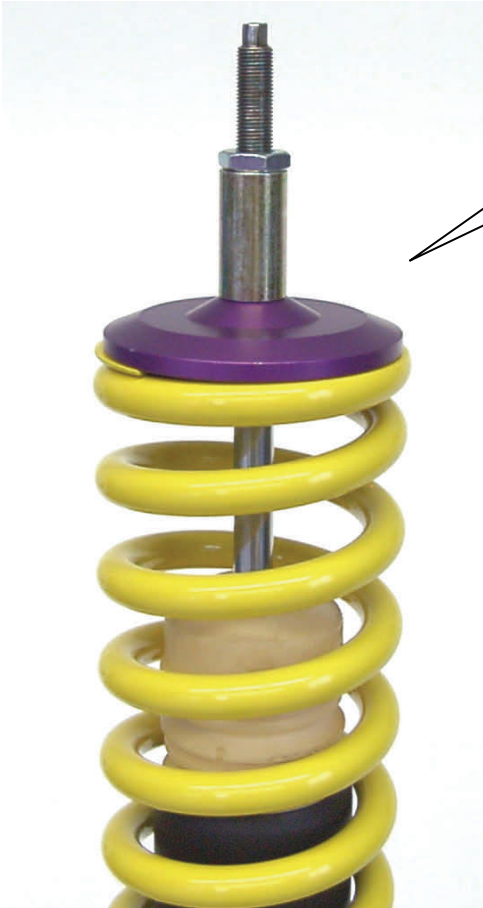
Angeliefertes Federbein. Supplied coilover strut

Das Original - Stützlagergummi und die Zentrierscheibe, wie im Bild dargestellt, aufsetzen, dann das Federbein mit den Originalteilen wie beim Serienfahrwerk mit der Karosserie verschrauben. Das Anzugsdrehmoment der Kolbenstangenbefestigung beträgt 25Nm. Die Einbauhinweise des Federbeines in das Fahrzeug entnehmen Sie bitte den Unterlagen des Fahrzeugherstellers.