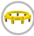
Cover - Pull Type