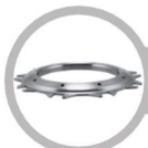
Pressure Plate Face: