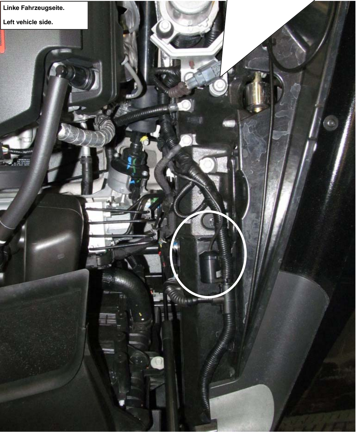
Linke Fahrzeugseite. Left vehicle side.

Stilllegungen mit den mitgelieferten Kabelbindern am Fahrzeug montieren. Leitung der Stilllegung in den Originalstecker einstecken. Auf die korrekte Verriegelung des Steckers achten! Install the cacellation kit with the supplied cable ties on the vehicle frame. Connect the cable from the cacellation kit into the standard wire harness of the vehicle. Insert the standard connector into the electronic component connector until it locks.