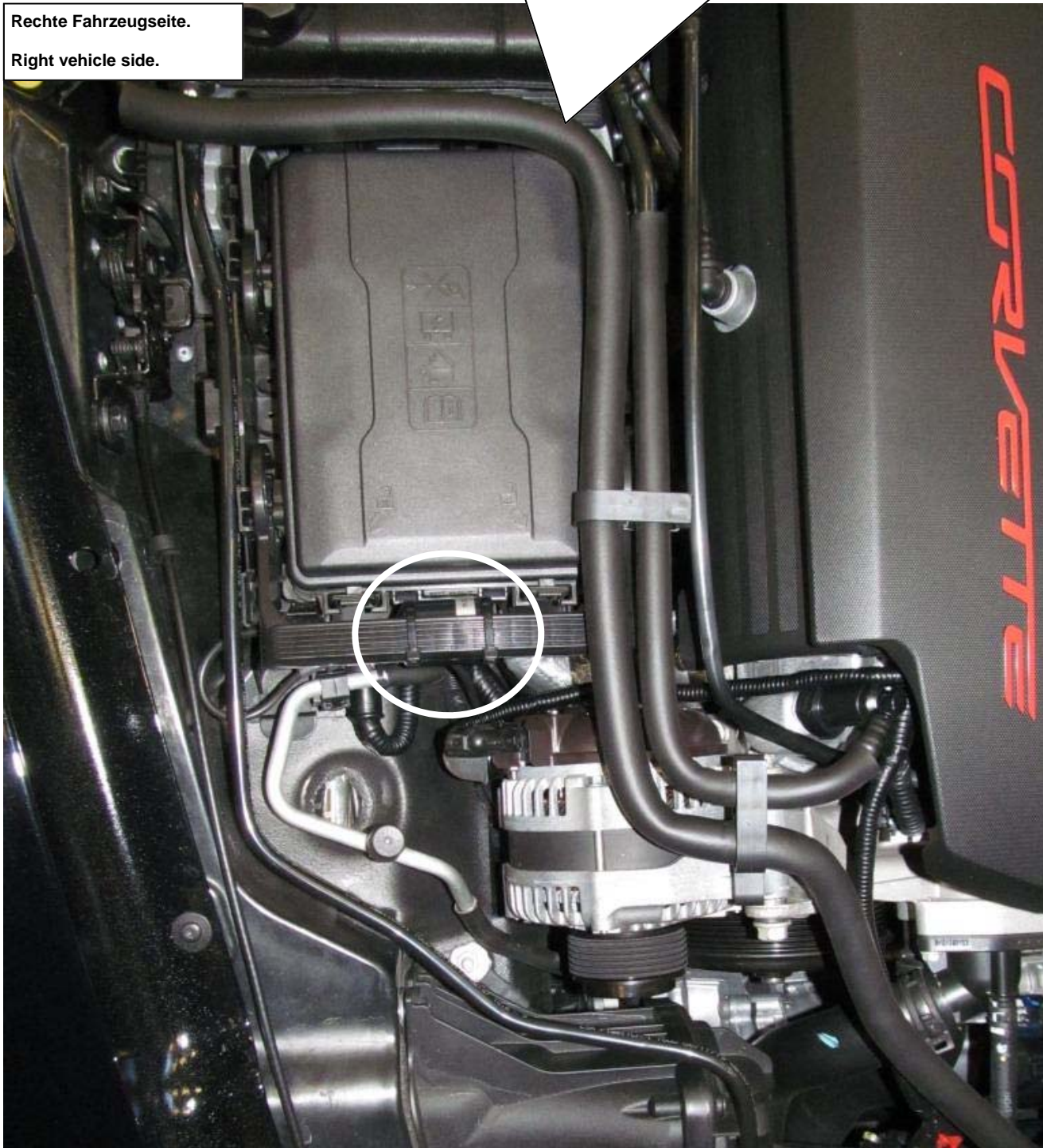
Rechte Fahrzeugseite. Right vehicle side.

Stilllegungen mit den mitgelieferten Kabelbindern am Fahrzeug montieren. Leitung der Stilllegung in den Originalstecker einstecken. Auf die korrekte Verriegelung des Steckers achten! Install the cacellation kit with the supplied cable ties on the vehicle frame. Connect the cable from the cacellation kit into the standard wire harness of the vehicle. Insert the standard connector into the electronic component connector until it locks.