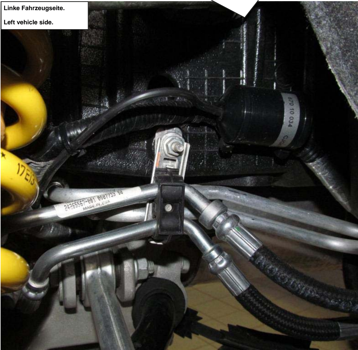
Linke Fahrzeugseite. Left vehicle side.

Stilllegungen mit den mitgelieferten Edge Clips am Fahrzeug montieren. Der Stecker wird mit Kabelbindern am Kabelbaum befestigt. Leitung der Stilllegung in den Originalstecker einstecken. Auf die korrekte Verriegelung des Steckers achten! Install the cacellation kit with the supplied cable ties on the vehicle frame. Fix the Connector with cable ties. Connect the cable from the cacellation kit into the standard wire harness of the vehicle. Insert the standard connector into the electronic component connector until it locks.