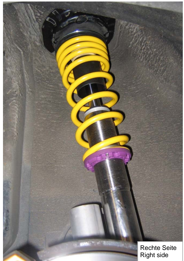
Rechte Seite Right side