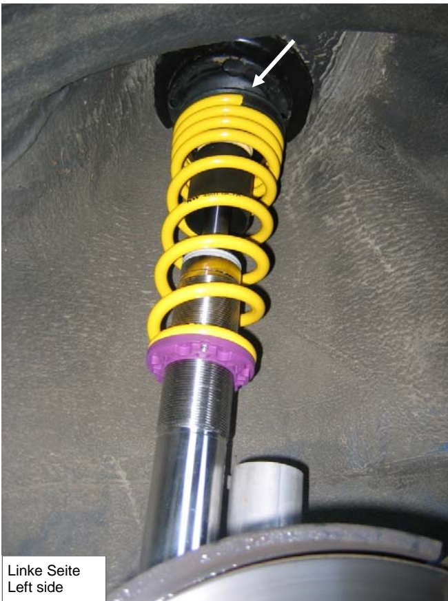
Linke Seite Left side

The upper end of the spring must show towards the left vehicle side.