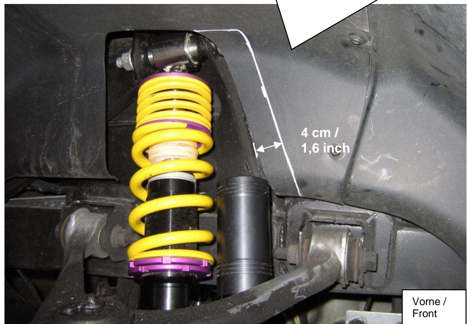
Vorne / Front

For enough free space, the wheel housing inside paneling must be cut out (see picture).