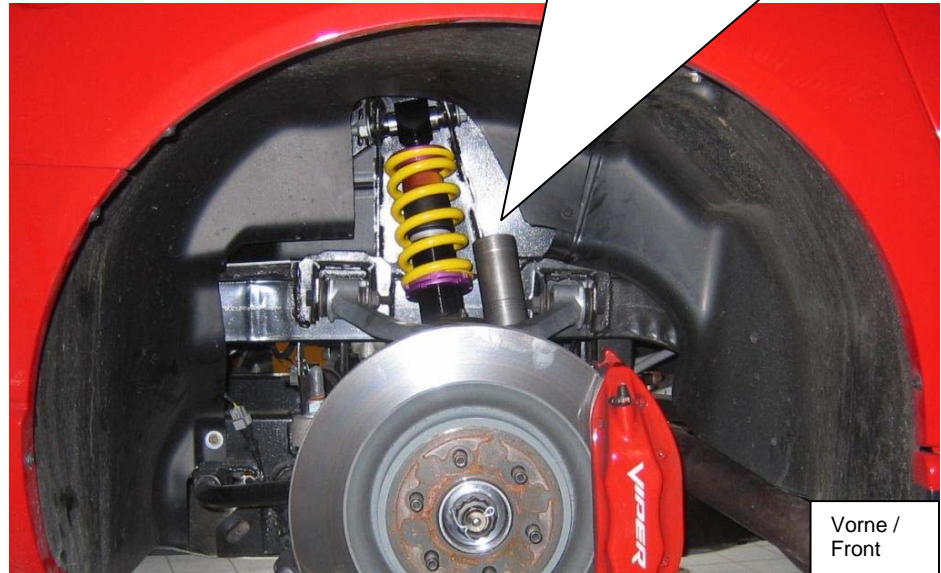
Vorne / Front

Für genügend Freiraum, muss die Radhausinnenverkleidung ausgeschnitten werden (siehe Bild).